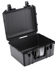
1507NF No Foam