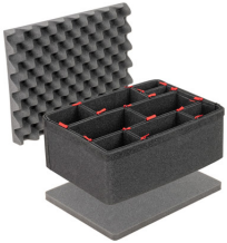
1507TPKIT Kit de séparation de la valise TrekPak