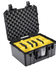
1507WD With Padded Dividers