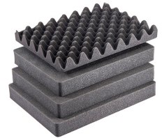
1507AirFS Jeu de mousses de rechange, 5 pièces