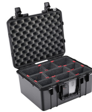
1507TP With TrekPak Divider System