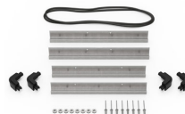
iM2275-BEZEL Support de platine base