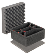
iM2275TPKIT Kit de séparation de la valise TrekPak