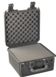
iM2275-X0001 With Foam