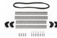
iM2275-BEZEL-LID Trousse de cadre de couvercle