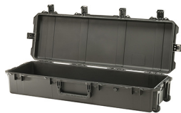
iM3220-X0000 No Foam