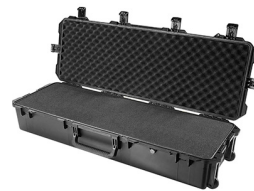
iM3220-X0001 With Foam