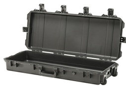
iM3100-X0000 No Foam