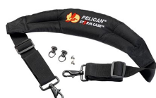
iM-STRAP-S-VER2 Bandoulière rembourrée