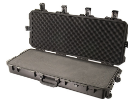
iM3100-X0001 With Foam