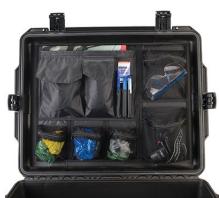
iM27XX-UTILITYORG Pochette utilitaire