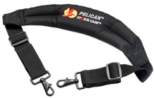
iM2370-STRAP-S Bandoulière rembourrée amovible