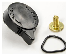
iM-VALVE-M-B Soupape de purge manuelle