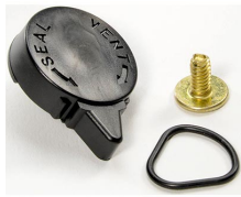
iM-VALVE-M-B Soupape de purge manuelle