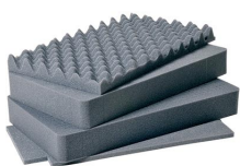
1511 4 St. Ersatz- Schaumstoffeinsätze