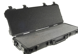
1720WF With Foam