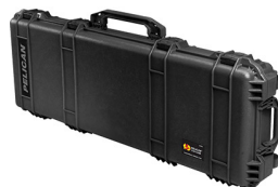
1720NF No Foam