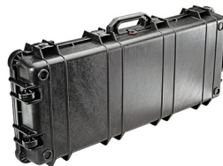
1700NF No Foam