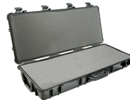
1700WF With Foam