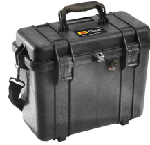
1430NF No Foam