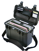
1437 With Padded Office Divider Set & Lid Organizer