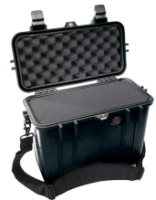
1430WF With Foam