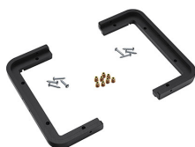
1430PF Panelrahmen für Spezialanwendungen