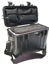
1434 With Padded Dividers & Lid Organizer