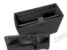
1436 Office Divider Kit