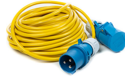
9606E Power Cable