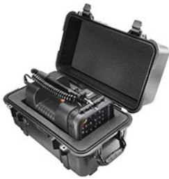
1460AALG 1460 Schutzkoffer mit passendem Schaumstoffeinsatz