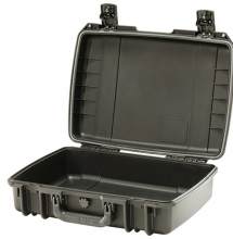
iM2370-X0000 No Foam