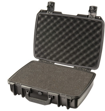
iM2370-X0001 With Foam