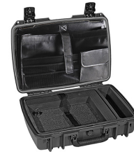
iM2370-X0003 Computer Case Deluxe