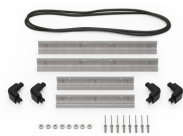
iM2200-MBEZ-B Bodenlünnette (metrisch)